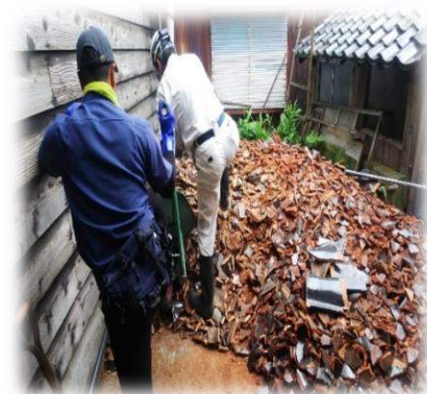
▲山形県沖地震でのボランティア活動より(昨年6月)