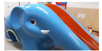
どうさん滑り台も人気です

立体駐車場から雨に濡れずに入れるので、ぜひ、遊びに来てくださいね。お待ちしております。