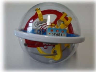
のうとれげーむ 100巡礼の迷宮