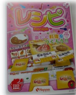
れしぴ ていばんりょうりへん レシピ(定番料理編)