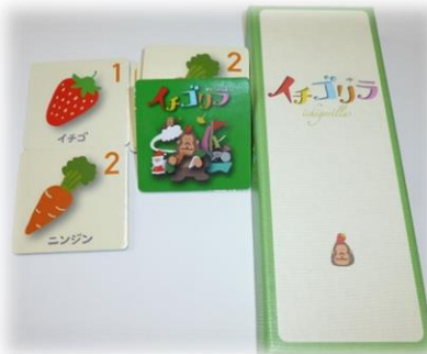
いちごりら イチゴリヤ