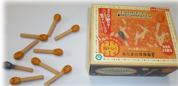
マッチぼうばずる マッチ棒パズル あたまの体操