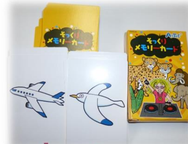
そっくりメモリーカード