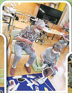
魚つりなら おまかせあれ!