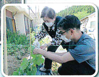
今年も ナスやトマト、さつまいもなど たくさん植えました!!