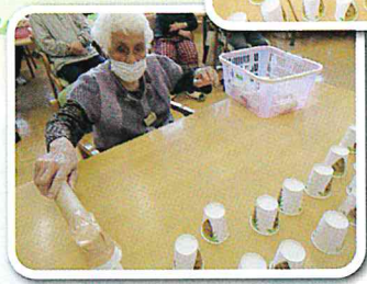
とようら名物 たけのことり ゲーム 熊やモグラに ご注意!!