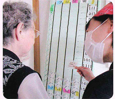
ご家族作成の薬カレンダーで服薬確認