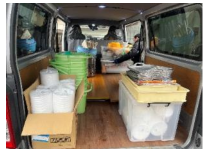
▲他にも多くの企業、団体、個人の皆さまより食材、資材等の提供がありました！