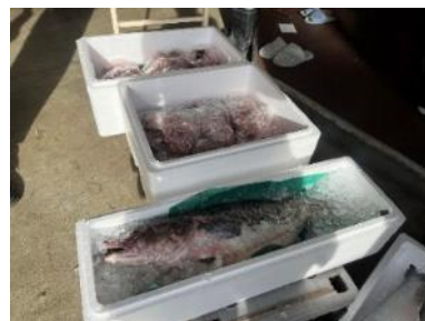
▲寒だらは庄内浜文化伝道師有志より