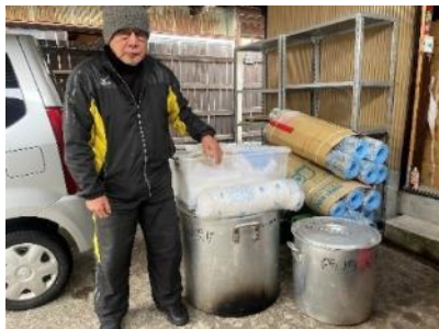
▲1/6 から準備と調整等がスタート！