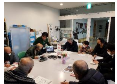
▲1/10 17時から 炊き出しメンバーと支援者、社協職員等による最終打合せ（ボランティアセンターで）