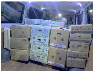
▲野菜類は庄内青果市場より！