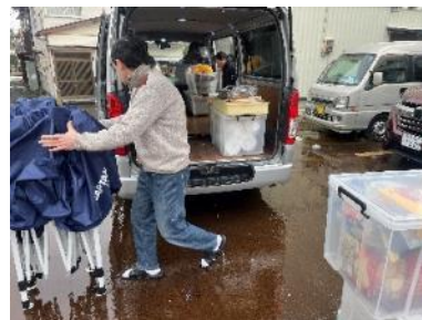
▲1/9 から徐々に積み込み開始！