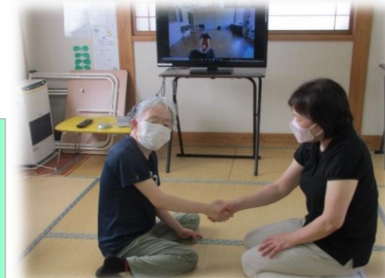
やさしく握手。笑顔になるね！