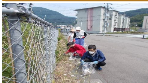
県道沿いにもゴミが沢山ありました。

もみじが丘では、毎年春と秋の2回、もみじが丘やe-モッチ周辺のごみ拾い・草むしり等の清掃活動を行っています。今年は就労B型では、グループごとに分かれ温海小学校・温海交番付近のごみ拾いをするチームとAコープあつみ方面のごみ拾いをするチームに分かれて地域貢献活動を行いました。茂った草の中にもごみがたくさん落ちており、日ごろお世話になっている地域をきれいにする事が出来ました。