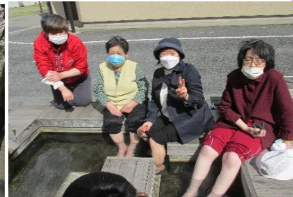
女子には足湯がサイコー！