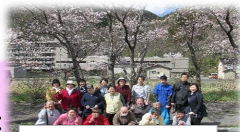
さくらの木の下でパチリ

4月16日、もみじが丘を出発して桜の木の下で集合写真を撮りました。天気にも恵まれぽかぽか陽気の中で足湯に入り、暖かい風ときれいな空気、川のせせらぎの音を聞きながら温海温泉を満喫しました。