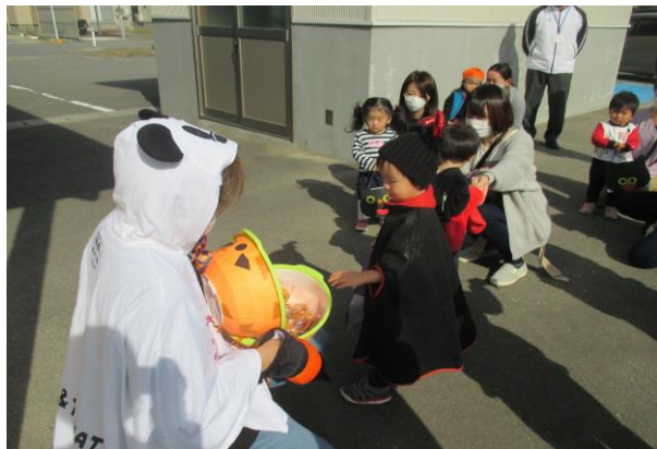
仮装して、ハロウィン散歩。近所のデイサービスさんへ行き、お菓子を頂きました。