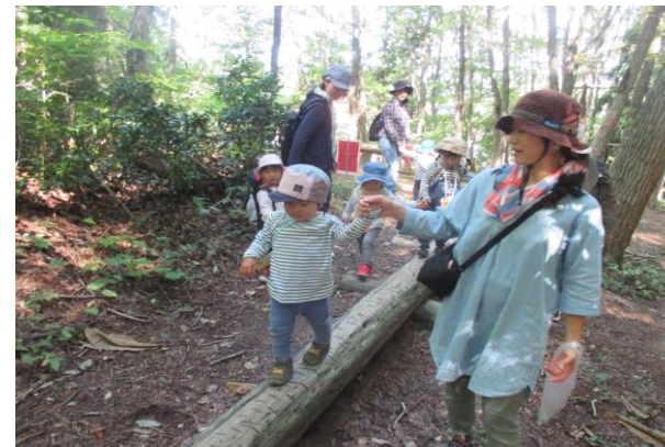
金峰少年自然の家にて秋探し。一生懸命に山を登ったよ。一本橋にも挑戦だ！