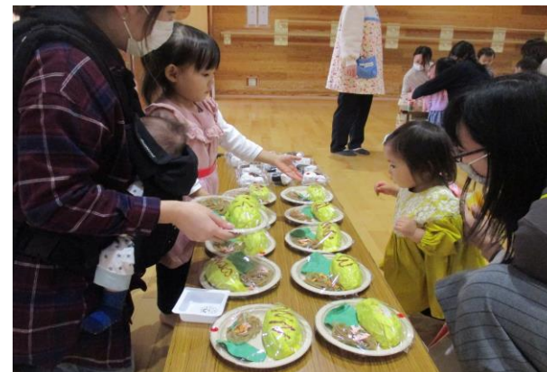
『ください。』『はい、どうぞ。』おみせやさんごっこ。お買い物、楽しいな。