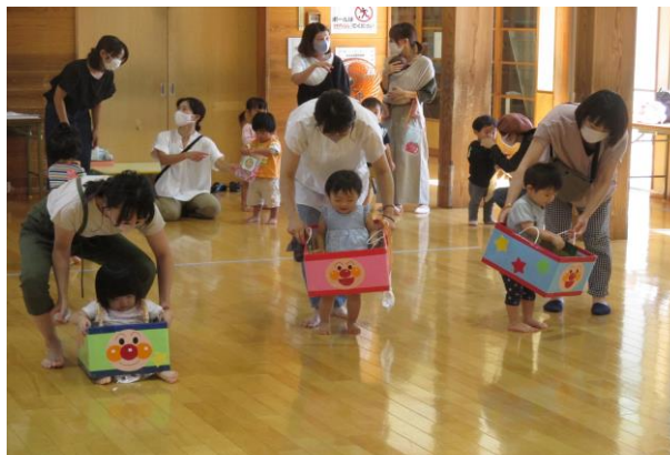
うんどう会ごっこ！よーい どんっ！ 今年は、はなまるうんどう会できるかな……