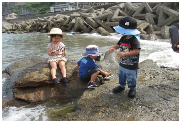
小堅保育園さんへ遠足！ 海へのお散歩へ出掛けました。海だいすき！

子ども達も、お母さんも、ここでは皆が笑顔でいられますように……。スマイルをテーマに活動しています。