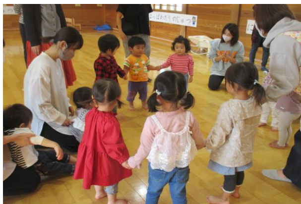
みんなで、まあるくなって『さようなら！』 また来週会おうね！！