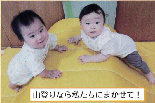
山登りなら私たちにまかせて！

0才から2才までのお子さん56名をお預かりしています。くしびきの自然の中でのびのびと遊び、園庭の畑で野菜を収穫したり、クッキングをしたりして楽しんでいます。一人一人の気持ちに寄り添いながら、子どもたちが安心して笑顔で過ごせるように心掛けています。