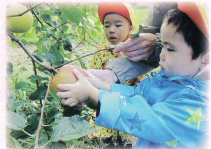
大きいりんご見つけた！