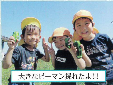
大きなピーマン採れたよ!!