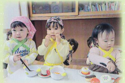
ママみたい♡ごちそう食べて～!