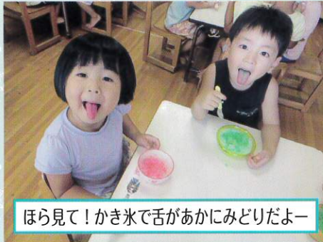
ほら見て！かき氷で舌があかにみどりだよー