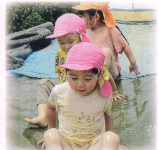
手作りのウォータースライダー！