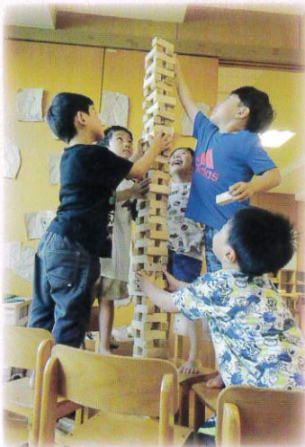
どこまで高く できるか挑戦だ！

0歳児から5歳児のお子さん39名をお預かりしています。豊かな自然のなかで、のびのびと元気いっぱい遊んでいます。異年齢交流や地域の方とのふれあい、山遊びや田植えなどの実体験を通して、優しい気持ちや豊かな感性を育てています。