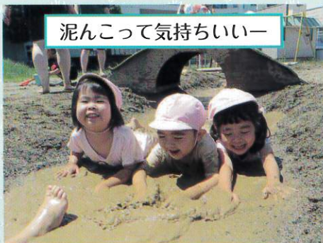
泥んこって気持ちいいー