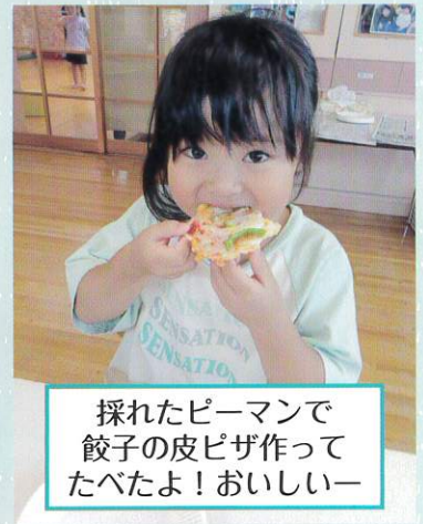
採れたピーマンで餃子の皮ピザ作って食べたよ! おいしいー