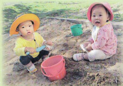
砂遊びっておもしろい♪