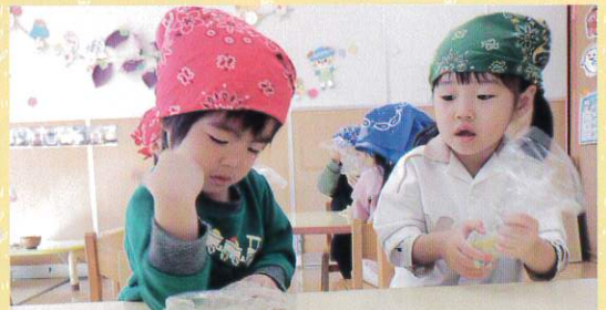
発見！！こうするとお芋が簡単につぶれるよ！