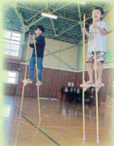
竹馬乗れるようになったよ～!

0歳児から5歳児のお子さん44名をお預かりしています。たくさん遊び、しっかり甘えられる環境を大切に、子どもたちがありのままの姿で過ごせるよう心掛けています。地域の方との触れ合いも多く、子ども達の笑顔にもつながっています。