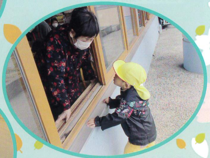
園児の皆さんを見つめる眼差しが とても優しいですね。