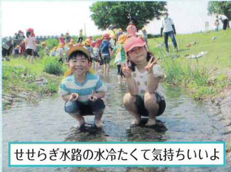
せせらぎ水路の水冷たくて気持ちいいよ

3歳児から5歳児のお子さん74名をお預かりしています。行事や日々の遊びから見られる異年齢交流など、たくさんの経験を通し学び、子どもが心身共に育つことを願っています。