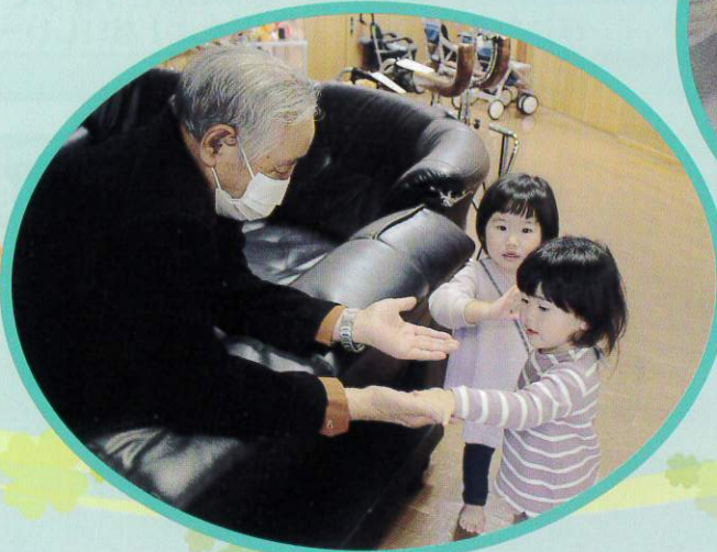
おばあちゃんと楽しいおしゃべり、 何を話しているのでしょうかね ないしょ、ないしょのお話し