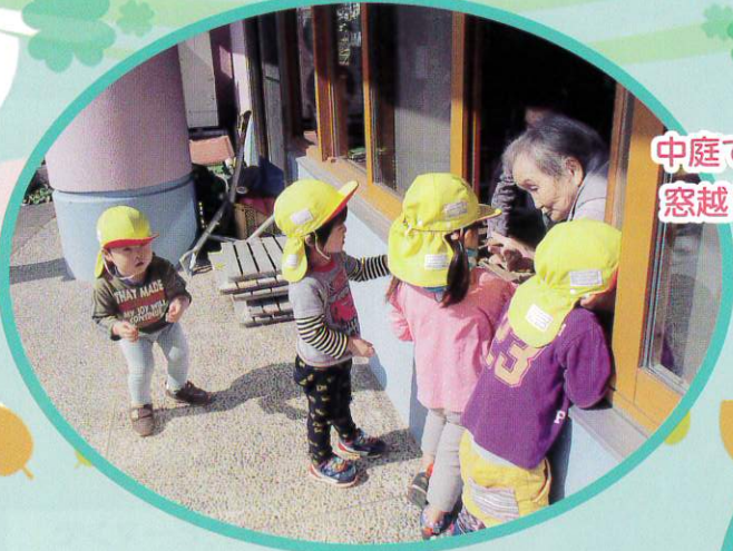
中庭で遊んでいる園児の皆さんと 窓越しでお話し、楽しそうです。

デイサービスセンターくしびきの特徴は、くしびき保育園の園児の皆さんとの日常的な交流です。 今年から新たに始めた中庭交流では、天気の良い日に元気よく遊んでいる姿を眺めたり、窓を開け、楽しくお話をしています。日中はデイホールに遊びに来てくれたり、帰りの時には玄関ホールでお見送りをしてくれるなど、一日を通して園児の皆さんとのふれあいを大切にしています。 そんな日常の様子を紹介します。