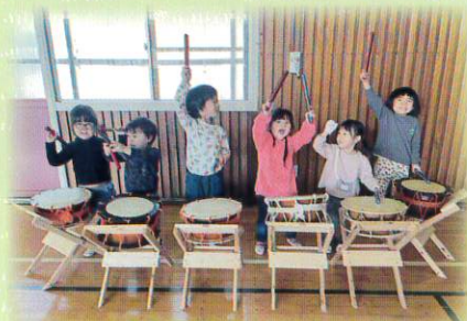
ドンドン、ヤァー! 決まってる?