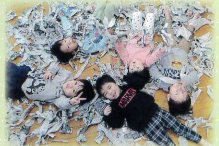
新聞びりびり～楽しいね!!