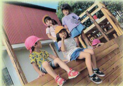
大きい船、かっこいいでしょ♡